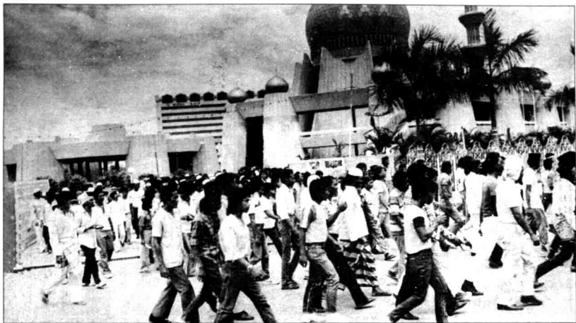
Gambar 7 Tunjuk perasaan rakyat di depan Masjid Negeri pada 14 Mac 1986