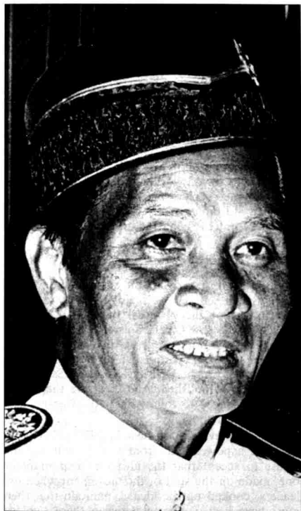
Gambar 6 Tun Mustapha