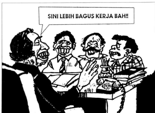
Gambar 3 Karikatur Harris anti-Kristian dan pro-Islam