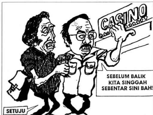
Gambar 5 Kartun yang sinis terhadap Islam