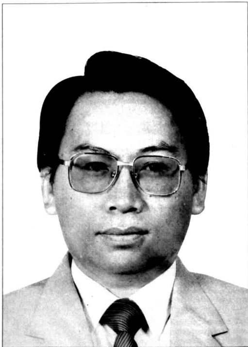
Gambar 1 Datuk Pairin, Ketua Menteri dan Presiden PBS – dikatakan anti-Islam dan anti-Persekutuan